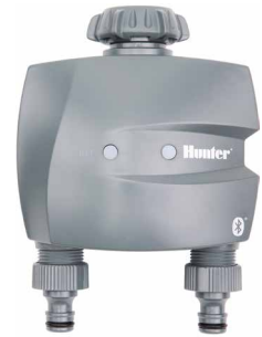
BTT-201 ทางน้ำเข้า : 3/4" และ 1" ทางน้ำออก : 3/4" สูง : 15.7 ซม. กว้าง : 13.5 ซม. ลึก : 7.6 ซม.