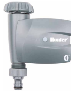
BTT-101 ทางน้ำเข้า : 3/4" และ 1" ทางน้ำออก : 3/4" สูง : 16.8 ซม. กว้าง : 12 ซม. ลึก : 6 ซม.