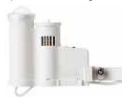
Solar-Sync แบบมีสาย