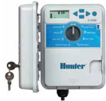
พลาสติกนอกอาคาร

สูง : 16.5 ซม. กว้าง : 14.6 ซม. ลึก : 5 ซม.