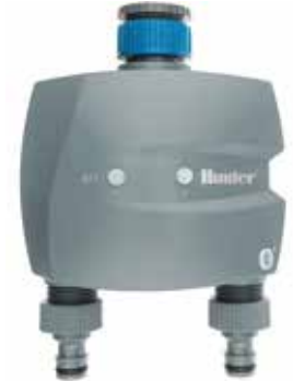
BTT-201 ทางน้ำเข้า : 3/4" และ 1" ทางน้ำออก : 3/4" สูง : 15.7 ซม. กว้าง : 13.5 ซม. ลึก : 7.6 ซม.