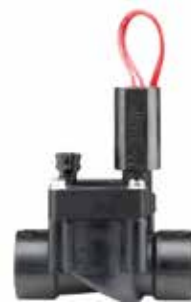
PGV-100G ทางน้ำเข้า : 1" (25 มม.) สูง : 13 ซม. ยาว : 11 ซม. กว้าง : 6 ซม.