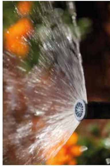
SPRAY-NOZZLE คุณสมบัติหัวจ่ายน้ำตามมุมฉีด