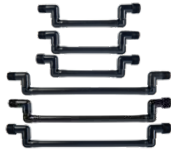
SJ Swing Joint