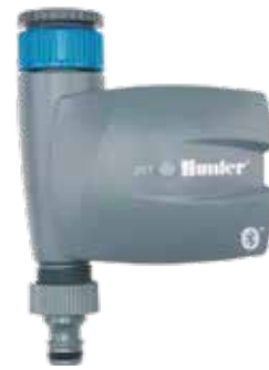
BTT-101 ทางน้ำเข้า : 3/4" และ 1" ทางน้ำออก : 3/4" สูง : 16.8 ซม. กว้าง : 12 ซม. ลึก : 6 ซม.