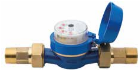
HC-075-FLOW-B (เกลียว BSP 20 มม.) HC-100-FLOW-B (เกลียว BSP 25 มม.)