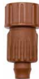
BTT-LOC ทางน้ำเข้า : 3/4" ทางน้ำออก : ท่อน้ำหยด 16-18 มม. สูง : 7 ซม. กว้าง : 3 ซม.