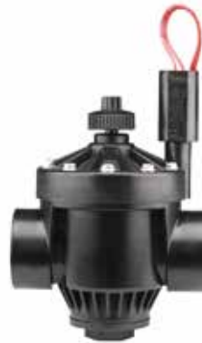
PGV-151 ทางน้ำเข้า : 1 1/2" (40 มม.) สูง : 19 ซม. ยาว : 15 ซม. กว้าง : 11 ซม.