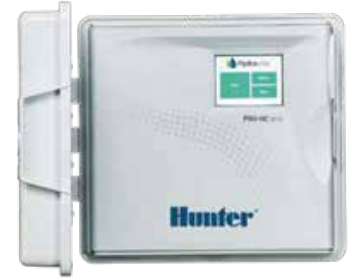
พลาสติกในอาคาร

สูง : 21 ซม. กว้าง : 24 ซม. ลึก : 8.8 ซม.