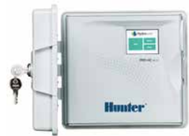
พลาสติกนอกอาคาร

สูง : 22.8 ซม. กว้าง : 25 ซม. ลึก : 10 ซม.