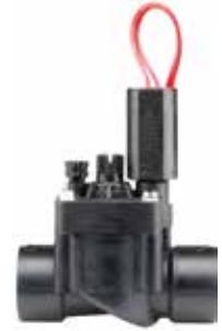
PGV-101G ทางน้ำเข้า : 1" (25 มม.) สูง : 13 ซม. ยาว : 11 ซม. กว้าง : 6 ซม.