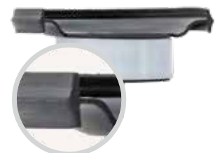
ไดอะแฟรมแบบ Double-beaded