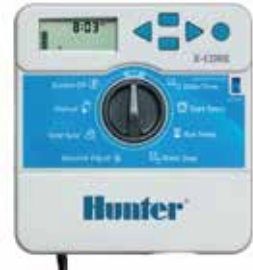
พลาสติกในอาคาร

สูง : 16.5 ซม. กว้าง : 14.6 ซม. ลึก : 5 ซม.