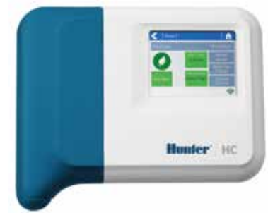
พลาสติกในอาคาร