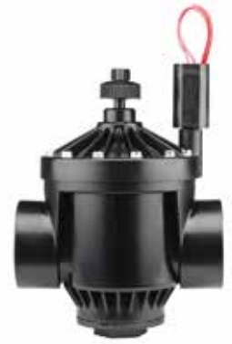
PGV-201 ทางน้ำเข้า : 2" (50 มม.) สูง : 20 ซม. ยาว : 17 ซม. กว้าง : 13 ซม.