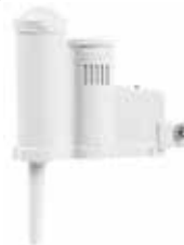
Solar-Sync เซนเซอร์

สูง : 11 ซม. กว้าง : 22 ซม. ลึก : 2.5 ซม.