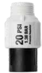
ตัวควบคุมแรงดัน ทางน้ำเข้า : 3/4" ทางน้ำออก : 3/4" สูง : 7 ซม. กว้าง : 4 ซม.