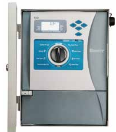
เหล็กสีเทาและสแตนเลส

สูง : 30.5 ซม. กว้าง : 35 ซม. ลึก : 12.7 ซม.